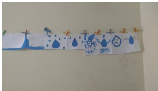
Que tipo de água você é Período Tarde