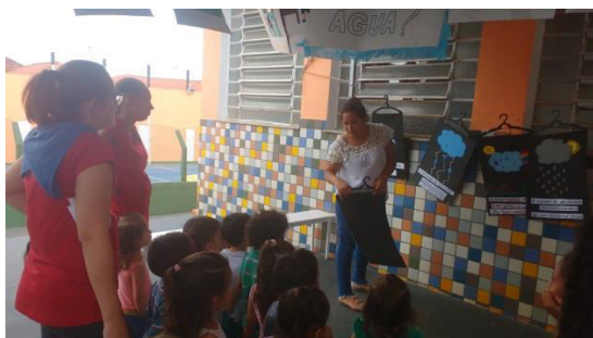
Historinha "A gotinha Cristal"