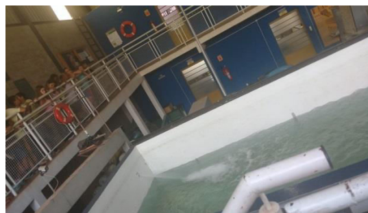
Visita a Fatec