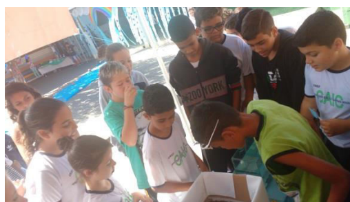
Experiência Afunda ou Boia