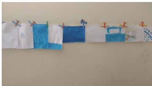
Que tipo de água você é Período Manhã